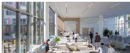
L'Académie 89-91 rue Gabriel Péri - 92120 Montrouge (VEFA)