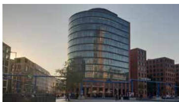
Postdamer Platz 10, Berlin, Allemagne