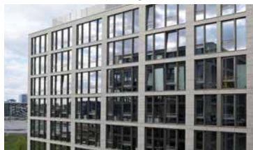
16-19 Mühlenstrasse Berlin, Allemagne