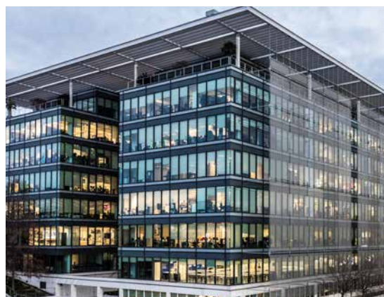
El Portico, Calle Mahonia 2 - Madrid, Espagne