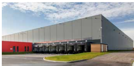
Zac de la Butte aux Bergers - 95380 Louvres