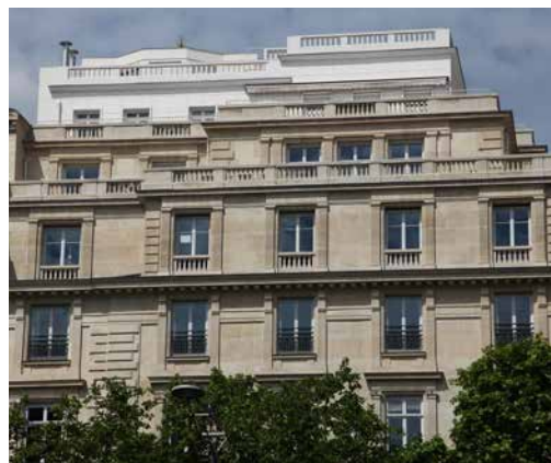
136 avenue des Champs Elysées - 75008 Paris