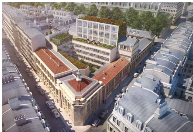
39 Avenue Trudaine - 75009 Paris (VEFA)