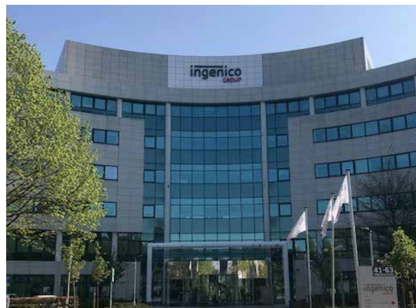
41-63 Neptunusstraat Hoofddorp - Pays-Bas