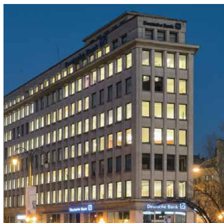
13-17 Marnixlaan 1000 Bruxelles - Belgique