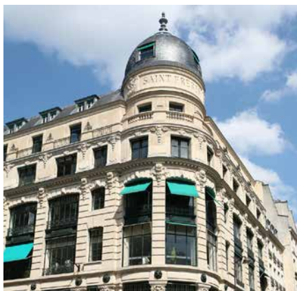
34 rue du Louvre - 75001 Paris