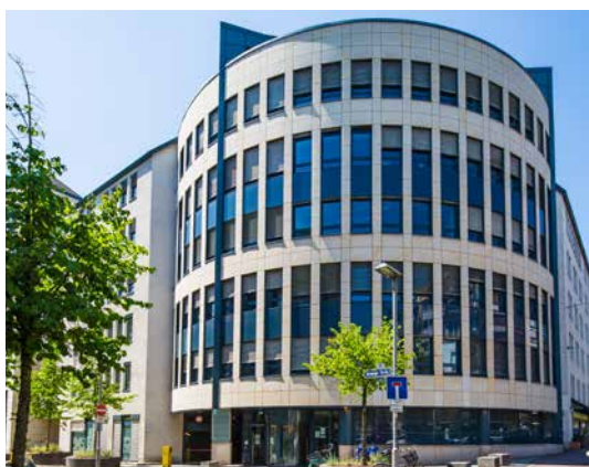
BBW - Grafstrasse / Wildungerstrasse Francfort, Allemagne