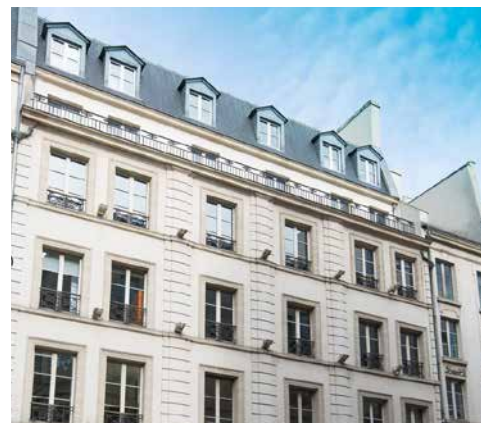
94 rue de Provence - 75009 Paris